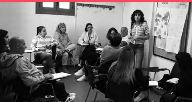
Xàtiva, 24 de octubre de 2022

Las entidades, asociaciones y profesionales que trabajan con la juventud están presentes en los territorios rurales para ofrecer a la población más joven alternativas a ese tipo de ocio, pero es habitual que su trabajo se desconozca. Las personas jóvenes que sí conocen a dichas entidades o la figura del trabajador o trabajadora juvenil y están motivadas para participar en las actividades que proponen los