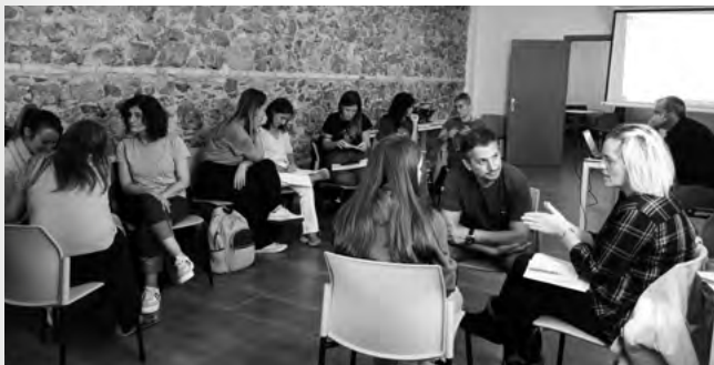
Benicàssim, 27 de octubre de 2022

Se reconoce también que el trabajo juvenil en territorios rurales dispone de poco presupuesto, por lo que se enfrenta a grandes dificultades para llevarse a cabo. Estas dificultades económicas se unen a la escasez de recursos de que disponen los y las profesionales, por ejemplo, en lo relativo a los materiales necesarios para el desarrollo de las actividades o a la disponibilidad de espacios de trabajo y reunión adecuados.