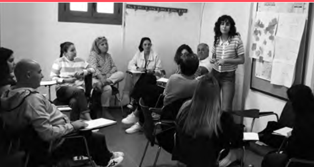
Xàtiva, 24 d'octubre de 2022

Les entitats, associacions i professionals que treballen amb la joventut són presents als territoris rurals per a oferir a la població més jove alternatives a aquest tipus d'oci, però és habitual que el seu treball passe desapercbut. Les persones joves que sí que coneixen aquestes entitats o la figura del treballador o treballadora juvenil i