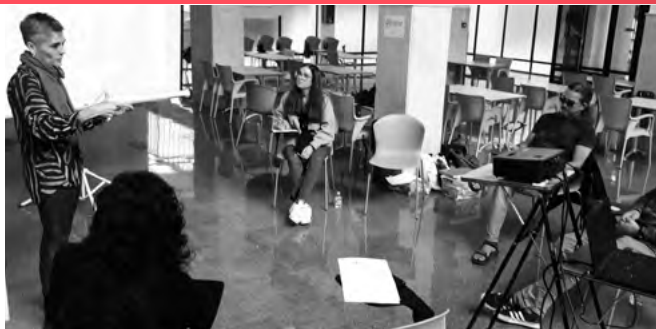
Alacant, 25 d'octubre de 2022